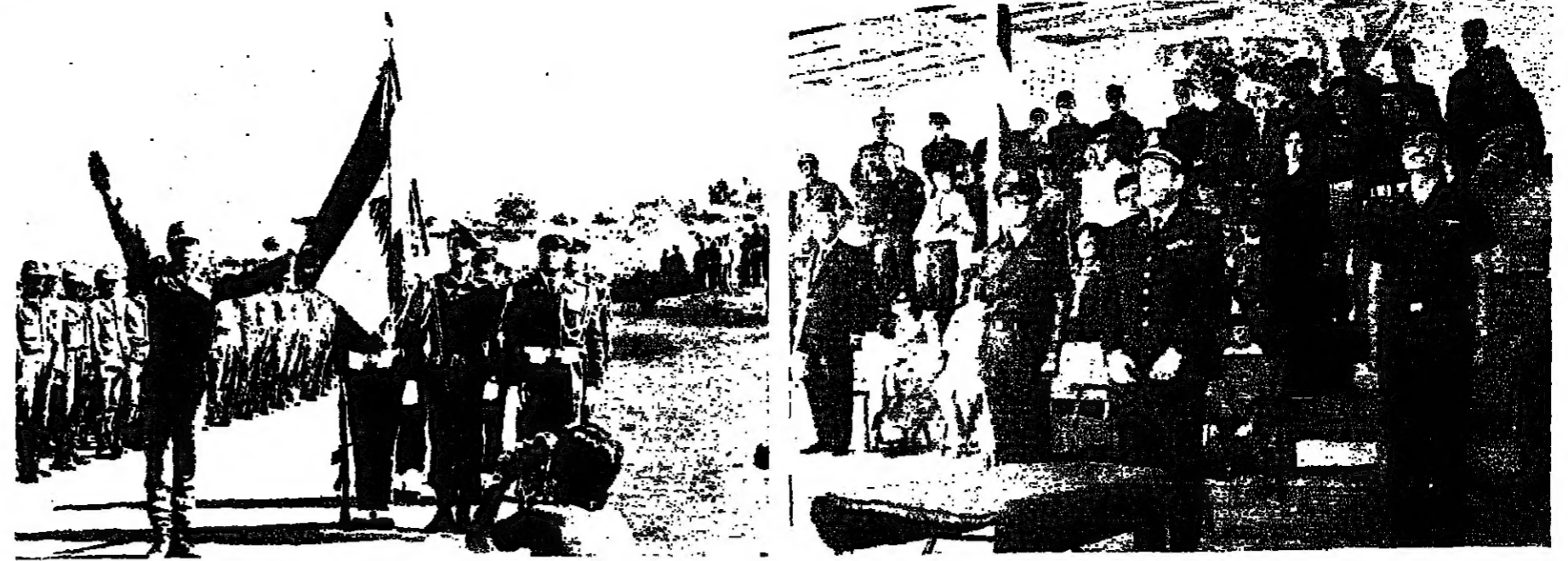
ممثل قائد الجيش العميد الركن الباني اثناء امتحان الاجمال